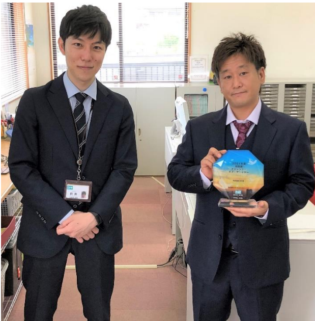
【株式会社 英 様】