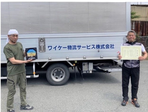
【ワイケー物流サービス株式会社 様】