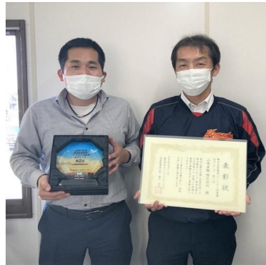
【山岡産輸株式会社 様】